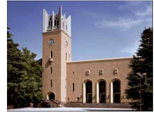
早稲田大学大隈講堂

大隈講堂は、1927 年に完成した重要文化財であり、早稲田大学創立 125 周年の 2007 年に記念事業の一つとして行われた多機能型文化ホールへの保存再生工事では、その既存状態の復原性、機能改善性の高さから、2008 年度の BCS 特別賞を受賞しております。